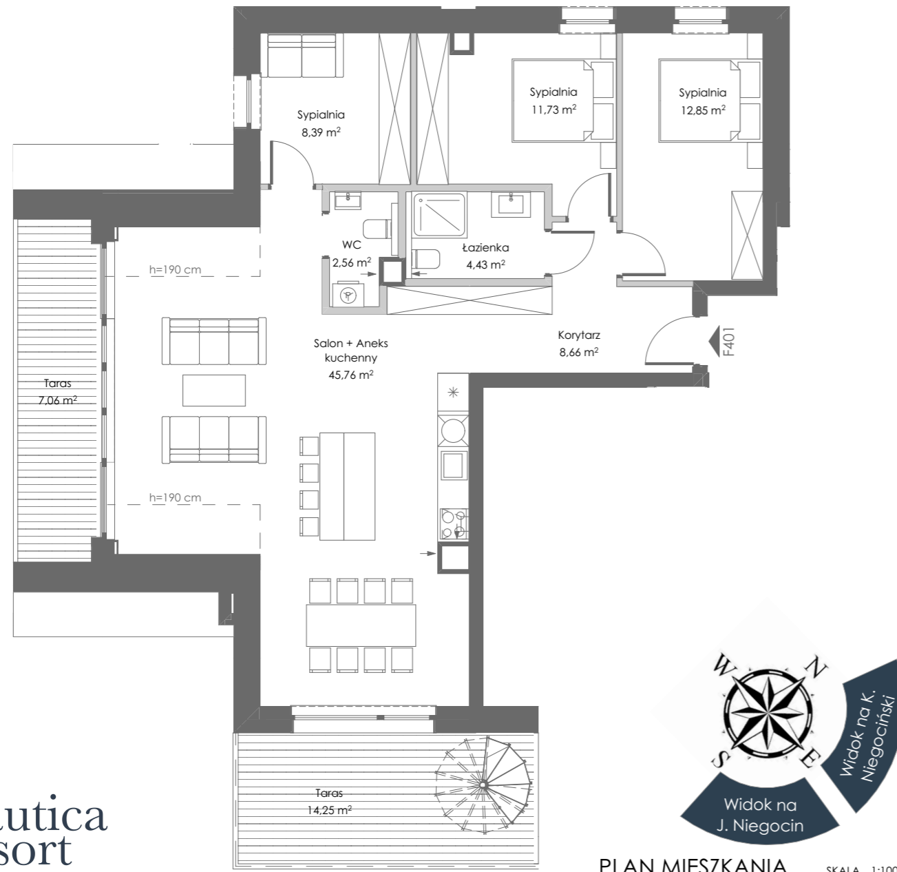
PLAN MIESZKANIA SKALA 1:100